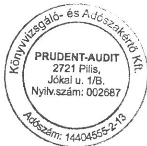
Fiel Edit kamarai tag könyvvizsgáló Kamarai tagsági száma: 005251